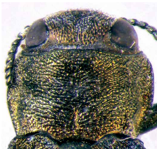
Fig. 4 – Agrilus suvorovi ssp. suvorovi , Russia, Amurskaya obl., Kundur, in cortecchia di Populus tremula , 27.V.1975, Danilevsky leg., capo e pronoto, 1,6 mm.

tre quella di A. suvorovi ssp. populneus è nella Francia mediterranea. Incuriosito dal fatto che una specie di Agrilus potesse avere un areale così esteso e con climi tanto diversificati, ho approfondito l'argomento giungendo alla conclusione che la sottospecie proposta da Schaefer (1946) è da considerarsi valida, nonostante il sospetto che questo Autore avesse proposto la sua forma come un ripiego, dopo aver preso atto che Obenberger (1935) aveva descritto precedentemente la sua dell'Ussuri. In effetti, populneus fu inizialmente descritto come semplice varietà e solo successivamente (1961) elevata a rango sottospecifico, dopo che Obenberger (in litt.) aveva comunicato a Schaefer che populneus era da attribuire a suvorovi da lui descritto. Arru (1952), nell'insuperato lavoro sulla biologia e la morfologia della specie, pur accennando alla corrispondenza tra i due AA., stranamente non si pronuncia sulla validità o meno delle due forme.