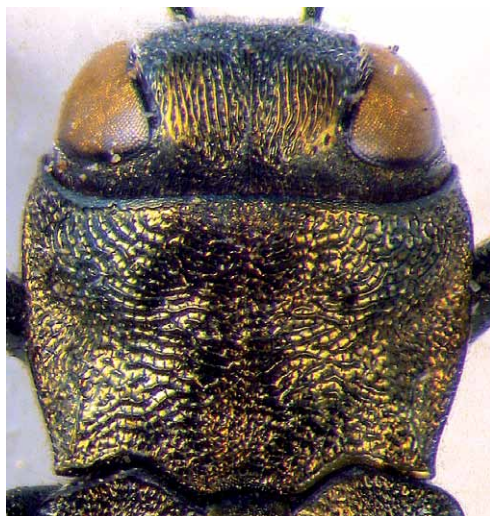
Fig. 3 – Agrilus suvorovi ssp. populneus , Italia, Caramagna Piemonte, ex larva Populus x euroamericana , VII.1980, Curletti leg., capo e pronoto, 1,8 mm.

La località tipica di A. suvorovi ssp. suvorovi è la regione dell’Ussuri nell’estremo est della Siberia, ai confini con la Cina orientale, men-